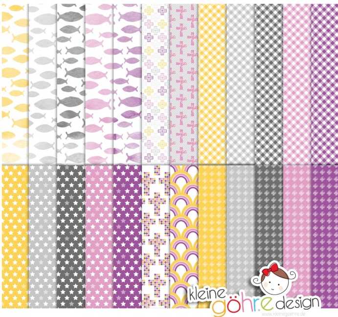
digitale Papiere "Taufe Kreuze lila rosa"