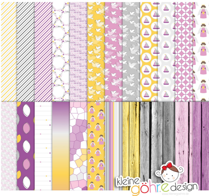
digitale Papiere "Taufe Muster2 lila rosa"