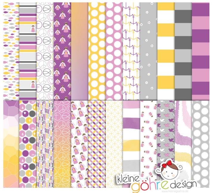
digitale Papiere "Taufe Muster1 lila rosa"